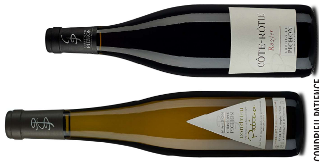
CONDRIEU PATIENCE CÔTE-RÔTIE ROZIER

Tout commence par des Saint-Joseph qui donnent dans l'admirable pour une petite vingtaine d'euros. Voire 25 euros pour le Saint-Joseph