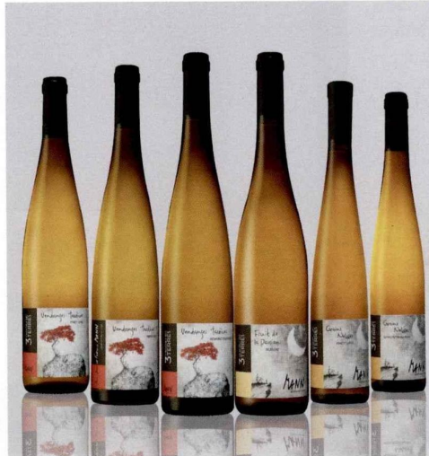
Le Domaine Mann-Vignoble des 3 Terres, situé en Alsace, dispose de cuvées en vendanges tardives et en sélection de grains nobles.