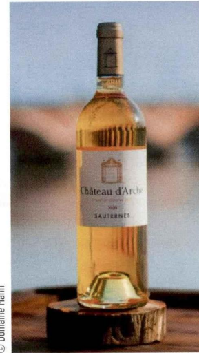
Le Château d'Arche est un grand cru classé de Sauternes en 1855.