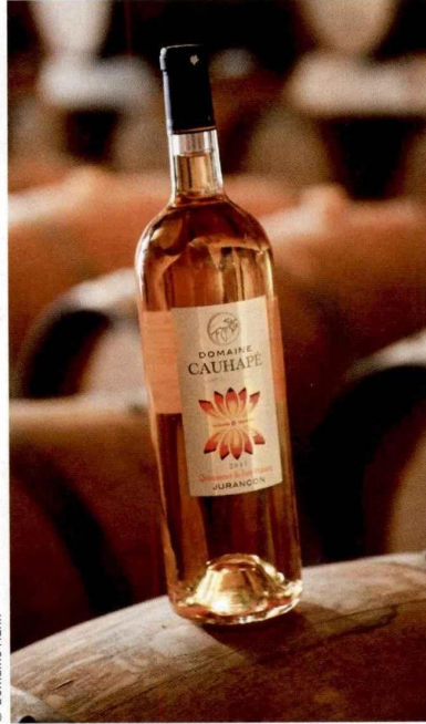
Le Domaine Cauhapé, en jurançon, produit désormais 80 % de blanc sec.