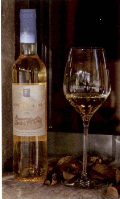
Le Château Monestier La Tour, en Dordogne, possède une cuvée de liqueux en AOC saussignac.