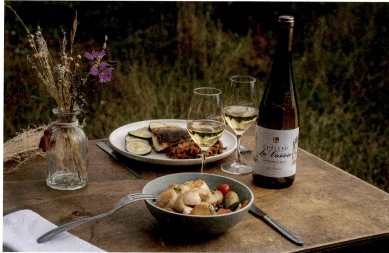
Le vignoble Château La Varière est présent sur les appellations de moelleux d'Anjou en coteaux-de-l'aubance, coteaux-du-layon, bonnezeaux et quarts-de-chaume.

Le sujet de l'accord de ces vins avec des mets constitue pour certains l'une des explications de leur mauvaise passe actuelle. « Ils sont très difficilement proposons à table tandis que les secs s'accordent plus facilement. Pourtant, ce sont des vins magnifiques », avance ainsi Antoine Dupré, directeur général de Vidal-Fleury. La maison de négoce spécialisée dans les vins de la vallée du Rhône compte dans sa gamme un muscat de Beaumes-de-Venise, une référence historique. « Le vrai souci est que